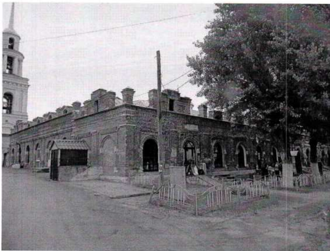
Общий вид. ул.ул. Советская – Почтовая