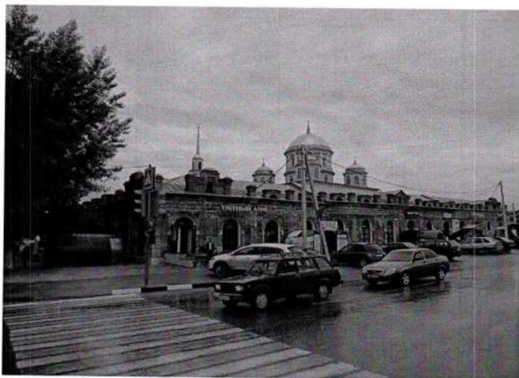
Общий вид ул.ул. Интернациональная - Почтовая