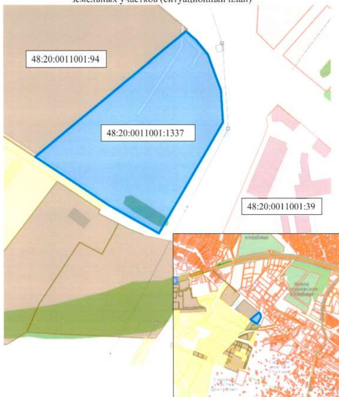
Схема расположения земельного участка в окружении смежно расположенных земельных участков (ситуационный план)